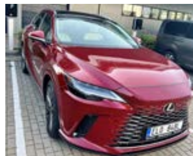
Lexus RX 350 h

ska pohodlně z Prahy za necelé čtyři hodiny přes Rozvadov a Regensburg, a to díky vozu Lexus RX 350h, zapůjčenému importérem značky. Vešla se tříčlenná posádka včetně golfových bagů a vozíků.