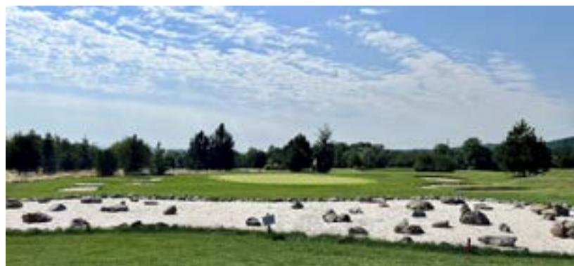
Písek místo vody před greenem