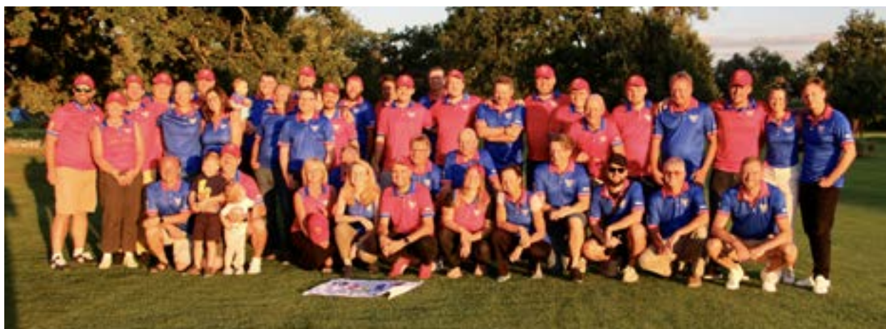
Český Ryder Cup 2023 na Hluboké

Hráči Modrého a Červeného týmu se sešli k výročnímu souboji ve formátu Ryder Cupu. Oba týmy jsou složeny výhradně z účastníků tour Hezká hra.