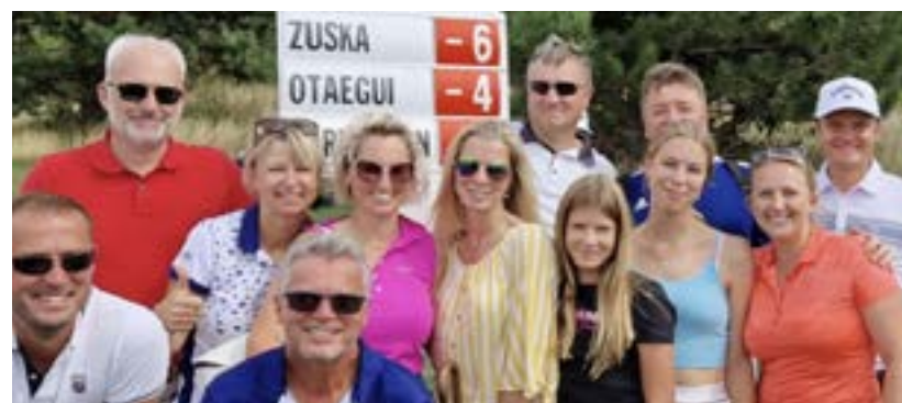
Fanoušci Jiřího Zusky z Podbořánek