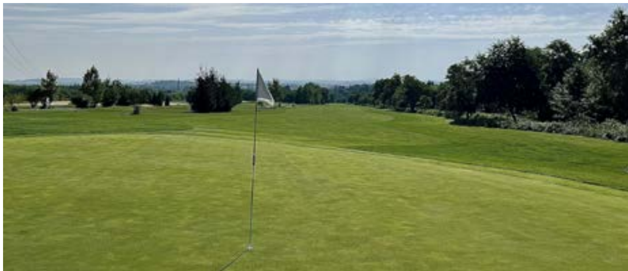
Molitorov výrazně zkvalitnil greeny

„Jestliže ostatní hřiště nařikají, co se týče návštěvnosti a nákladů, tak my rozhodně ne. Letos zase máme asi o třicet procent hráčů víc než loni,“ říká zapálený golfista, který své podnikatelské srdce vkládá do