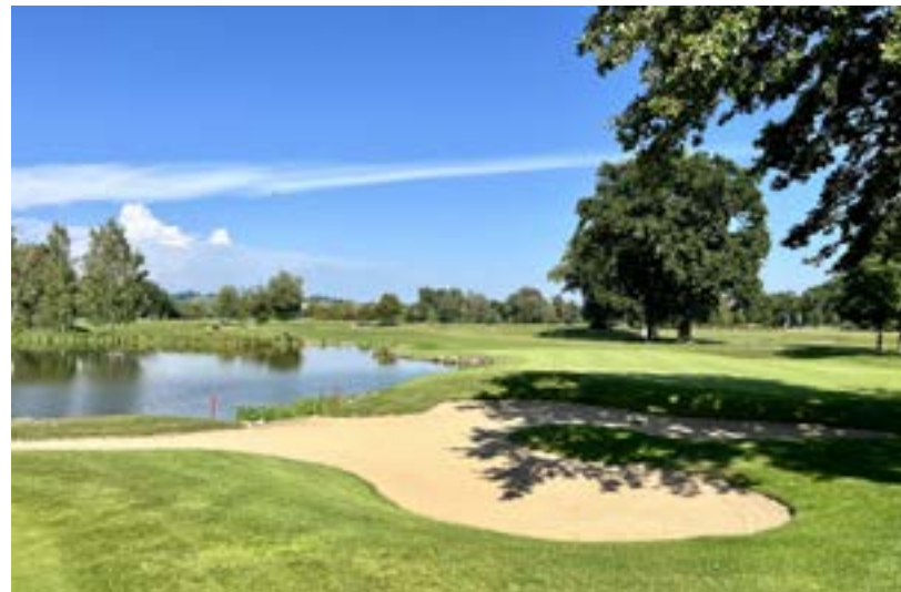
Hřiště Beckenbauer