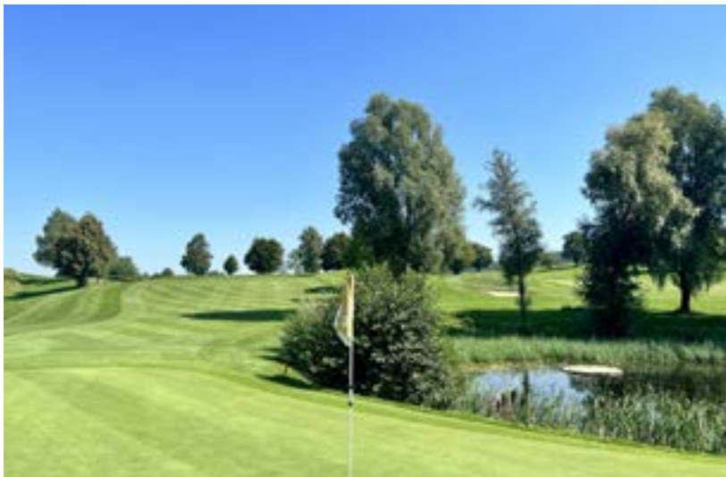
Hřiště Brunwies