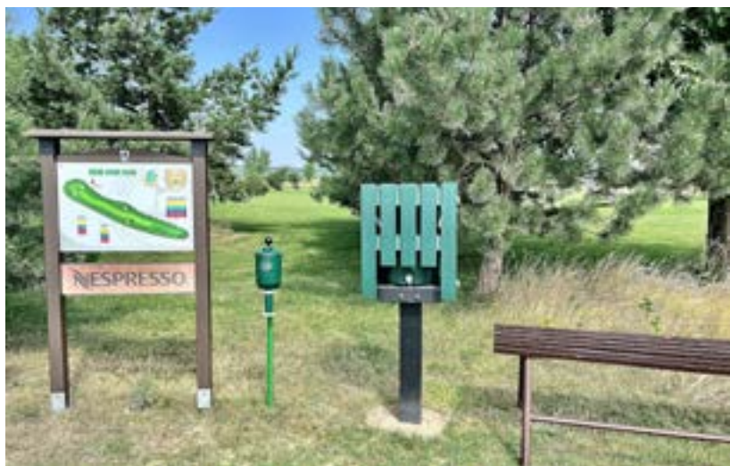
Pitná voda ve stojanu u odpaliště

A co se bude dít v Molitorově dál? Za drivingem se ještě dva roky budou na navážce z pražského metra stavět tři cvičné jamky s plnou délkou a kvalitou. Klub také konečně získal do svého vlastnictví starou budovu, která sousedí s parkovištěm, takže i tady bude co vytvářet. Třeba rozšířený hotel a další zázemí klubu.