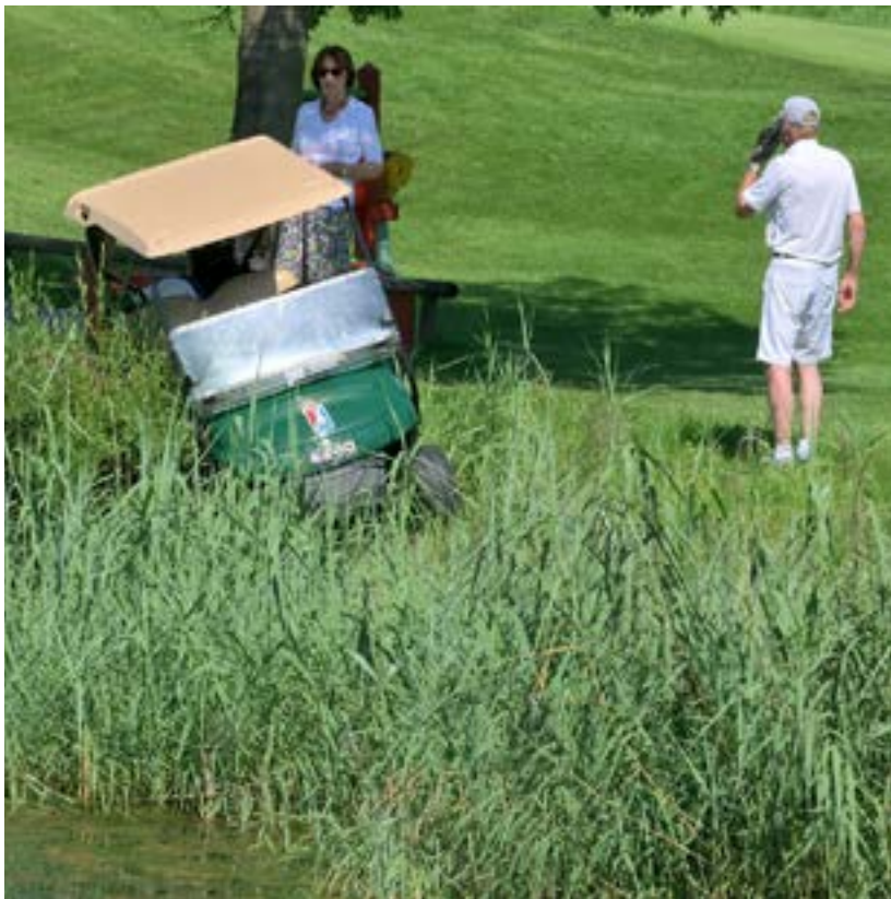
Tohle bude ještě dražší než dnes

Pro golfová hřiště půjde o nové náklady, které samozřejmě budou