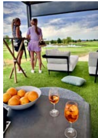
Výhled na 9. green ze stánku Innex

P.S. Když už se po turnaji rozdají dva miliony dolarů na prize money profesionálům, mohl by hlavní sponzor věnovat vítězi školní exhibice u Vltavy důstojnější částku na golfové pomůcky než pouhých 20 000 korun, nemyslíte?